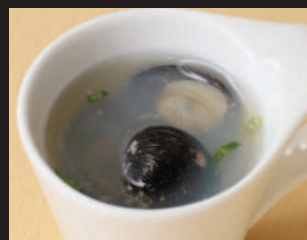
鬼じみのエスプレッソ 380円